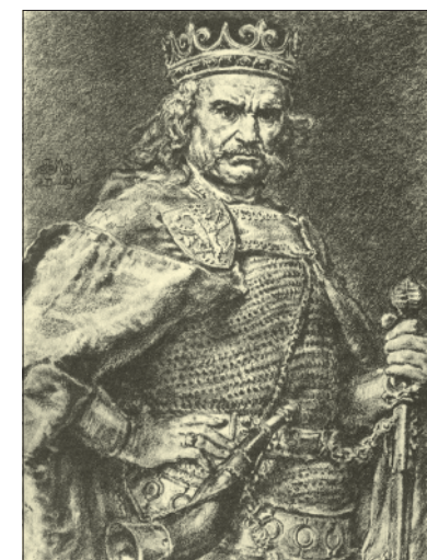
Władysław Łokietek (1306-1333) – portret Jana Matejki