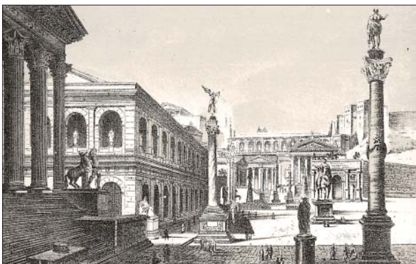
Forum w Rzymie

Rozkwit gospodarczy sprzyjał urbanizacji , czyli rozbudowie miast. Przebiegała ona szczególnie intensywnie w zachodniej części Cesarstwa. W miastach wytyczano regularną siatkę ulic przecinających się pod kątem prostym. W punktach centralnych, gdzie krzyżowały się dwie główne arterie komunikacyjne, budowane były fora (liczba poj. forum), czyli reprezentacyjne rynki. Przy nich wznoszono