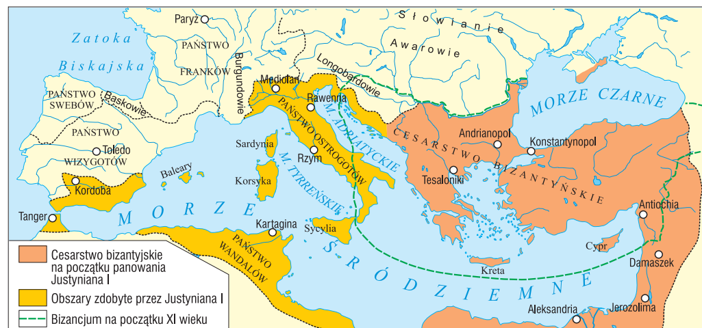
Zasięg Cesarstwa Bizantyjskiego we wczesnym średniowieczu

państwa. Chcieli odzyskać terytoria, które wcześniej odpadły od Imperium Rzymskiego.