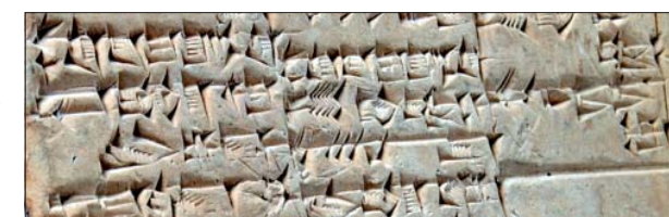
Materiałem pisarskim były gliniane tabliczki, na których wyciskano za pomocą trójkątnego ryłca znaki przypominające kliny, stąd nazwa pismo klinowe

Sumerowie stawiali budowle z suszonej cegły, a jedynie ściany zewnętrzne świątyń okładali wypaloną cegłą. Wynaleźli m.in. koło garncarskie oraz pismo, które początkowo miało charakter piktograficzny, czyli obrazkowy. Z czasem jednak coraz bardziej uprasz-