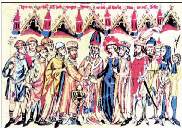
Miniatura ukazująca zaślubiny Henryka Brodatego z Jadwigą (z niemieckiego rodu Andechsów). Zwróć uwagę na wizerunek orła książąt śląskich

Wawelu przechowywane były szczątki św. Stanisława (kanonizowanego w 1253 roku). Legenda o zrośnięciu się jego szczątków szerzyła i umacniała tendencje zjednoczeniowe. Próbę zjednoczenia ziem polskich podjął Leszek Czarny . Ideę jedności Polski propagował kronikarz Wincenty Kadłubek.