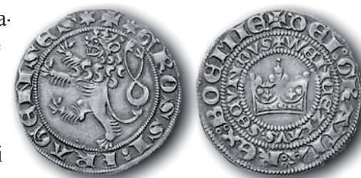
Grosz praski Waclawa II Czeskiego. Grosz był srebrną monetą o znacznej wartości. Określ, która grupa społeczna mogła być najbardziej zainteresowana tym, aby w Polsce i w Czechach posługiwać się wspólną monetą

Jego rządy wywołały jednak niezadowolenie w Polsce. Nowy władca na urzędy powoływał Czechów i Niemców. Jako król Polski uznał się lennikiem cesarza. Na wieść o rosnącym niezadowoleniu wobec rządów Waclawa, do Polski wrócił Władysław Łokietek. W 1305 roku wybuchło powstanie rycerskie skierowane przeciwko Czechom, które poparło Władysława Łokietka. Zbrojnej pomocy udzielili mu także Węgrzy. Tymczasem zmarł Waclaw II, a jego syn Waclaw III po roku rządów został zamordowany. Jego śmierć oznaczała koniec dynastii Przemysłidów. W Czechach władzę objął Jan Luksemburski. Nie miał on wystarczających sił, aby walczyć o polską koronę.