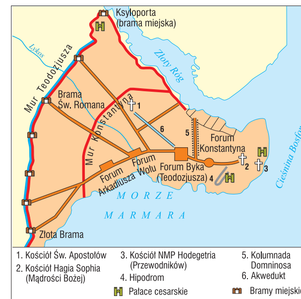
Plan Konstantynopola. Zwróć uwagę na obronne i komunikacyjne walory miasta

Innym wielkim osiągnięciem Justyniana stało się zebranie wszystkich rzymskich reguł prawnych i opublikowanie tzw. Kodeksu Justyniana . Nowością był dołączony do