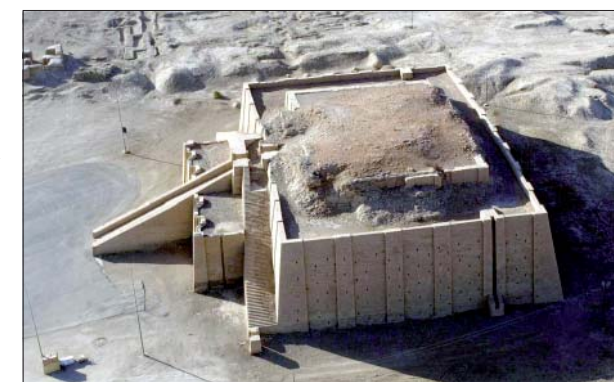
Ziggurat w Ur wybudowany około 2100 roku p.n.e. Ziggurat to monumentalna budowla sakralna w starożytnym Sumerze, Babilonii czy Asyrii w formie tarasowo uformowanej wieży

Na czele państwa-miasta stał król, który jednocześnie był najwyższym kapłanem. Wyobrażenia religijne mieszkańców Mezopotamii cechował politeizm , czyli wiara w wielu bogów. Wyobrażano ich sobie pod postacią ludzką. Takie wyobrażenie nazywane jest antropomorfizmem . Najazdy obcych oraz klęski żywiołowe były traktowane przez mieszkańców jako wyraz gniewu bogów. Aby przebłagać bogów, wznoszono im świątynie zwane zigguratami i tam składano ofiary. Przy świątyniach działały liczne grupy kapłanów.