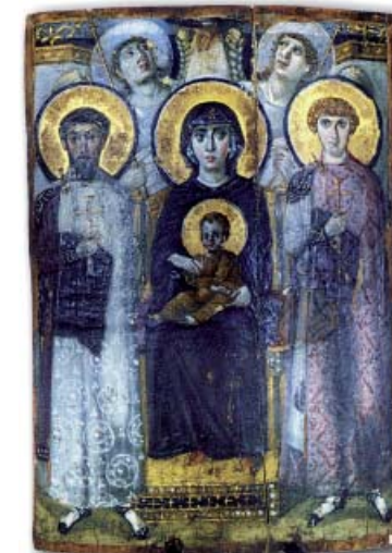
Wczesnośredniowieczna ikona bizantyjska. Ikony ukazywały Chrystusa, Matkę Bożą lub świętych

czących interpretacji prawd wiary. Jedną z nich dotyczyła oddawania czci świętym wizerunkom – ikonom . W VIII wieku pojawił się ruch obrazoburców ( burzących obrazy ). Jego zwolennicy, nawiązując do drugiego przykazania Dekalogu, zwalczali oddawanie czci obrazom i figurom religijnym. Ruch ten doprowadził do wieloletnich konfliktów, ale później został stłumiony.