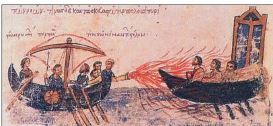
Miniatura z XI wieku przedstawiająca scenę walki z użyciem tzw. ognia bizantyjskiego, czyli mieszaniny m.in. saletry, siarki i ropy naftowej. Mieszanina ta zapalała się przy kontakcie z wodą morską. Stosowana była do odparcia wrogów Cesarstwa Bizantyjskiego

Justynian I Wielki był najwybitniejszym władcą Cesarstwa Bizantyjskiego we wczesnym średniowieczu. Częściowo zrealizował on plan odbudowy dawnego Imperium Rzymskiego. W VI wieku n.e. wodzowie Justyniana Wielkiego zajęli m.in. północną Afrykę, znaczną część Italii oraz południowo-wschodnie tereny dzisiejszej Hiszpanii. Zdobycze okazały się jednak nietrwałe. Od północy Cesarstwo Bizantyjskie było zagrożone przez Awarów, Słowian i Bułgarów. Na wschodzie i na południu odpierało ataki Persów i Arabów. Wprawdzie do VIII wieku n.e. władza monarchy była despocyjna, jednak autorytet cesarzy stawał się coraz słabszy z powodu biurokracji oraz ciągłych konfliktów i rywalizacji na dworze. Często najbliższe otoczenie panującego, łącznie z armią, decydowało, kto zostanie nowym władcą.