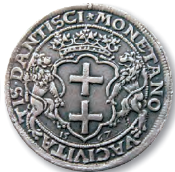
Talar gdański z podobizną Zygmunta Augusta i herbem Gdańska z 1567 roku. Rozpoznaj elementy tworzące herb miasta.

Dzięki tym przywilejom mieszczenie gdańscy