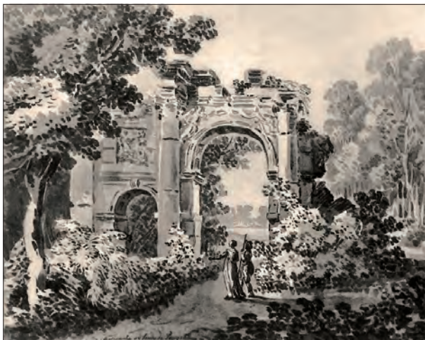
Element stylizowany na ruiny łuku triumfalnego w ogrodzie sielankowym na Powązkach, założonym przy współpracy Jana Piotra Norblina i Szymona Bogumiła Zuga [czyt. cuga]. Rysunek z 1800 roku.

Liczne pejzaże oraz sceny rodzajowe i rysunki były dziełem (pochodzącego z Francji) nadwornego malarza Czartoryskich, Jana Piotra Norblina . Ukazane przez autora sceny sejmikowe, zaprzysiężenie Konstytucji 3 maja, wydarzenia z powstania kościuszkowskiego są świadectwem życia politycznego epoki.